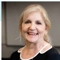
Par Lise Lacombe